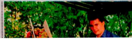
BILD HAT SICH IN HESSISCHEN KELTEREIEN UMGESCHAUT. ZEIGT NEUHEITEN UND TRENDS.

edeln Sorten, kreieren neue oder verwenden Apfelwein als Zutat in Lebensmitteln. Nach dem Motto: En Ebbelwei geht immer nei!